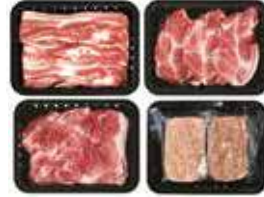
(냉장/떡갈비 냉동) 백정C 선물세트 80,000원 삼겹살 + 목살 + 앞다리살 + 떡갈비 각 600g