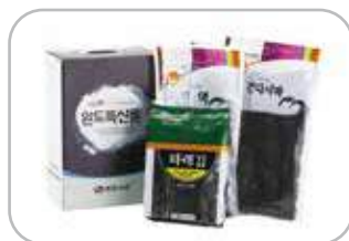
완도건어물세트 2호 미역 100g×2, 다시마 200g, 파래김 100장 47,000원