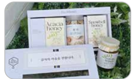
꿀+잡곡 콜라보 선물세트

620g 병 꿀×2개입(아카시아꿀, 야생화꿀) 향찰현미 500g 45,000원