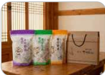
한과 선물세트 1호

620g 병 꿀×2개입(아카시아꿀, 야생화꿀) 향찰현미 500g 45,000원