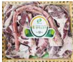
(냉동) 미한우 꼬리반골세트 55,000원 한우 꼬리반골(약4.5kg)