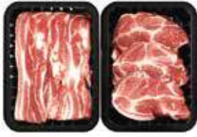
(냉장) 백정A 선물세트 49,000원 삼겹살 600g + 목살 600g