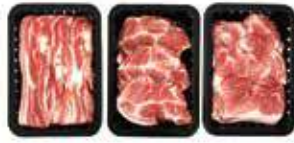
(냉장) 백정B 선물세트 67,000원 삼겹살 + 목살 + 앞다리살 각 600g