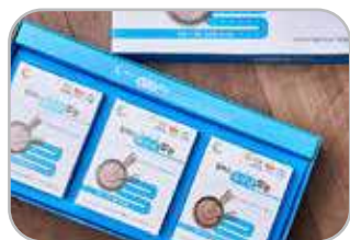
유산균쌀눈 선물세트 유산균쌀눈 3g×30포×3박스 50,000원