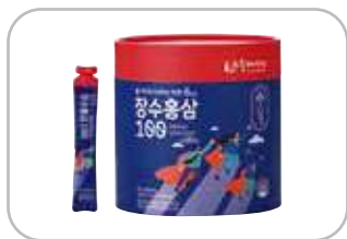
6년근 장수홍삼 100 10m×100포 43,800원