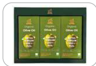
유기농 올리브유 스틱 선물세트 14입×3팩 29,700원