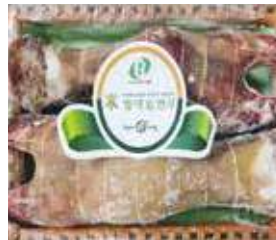
(냉동) 미한우 우족세트 55,000원 한우우족(2개, 약4.5kg)