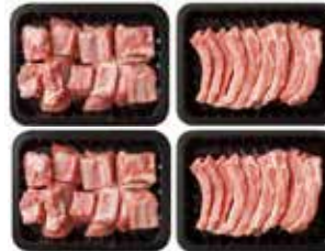
(냉장) 한돈갈비혼합세트 89,000원 한돈찜갈비 800g × 2팩 한돈등갈비 800g × 2팩