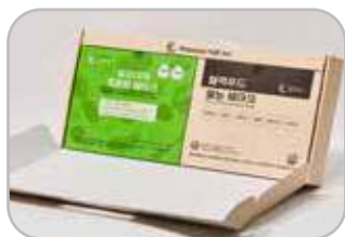
쉐이크 2종 선물세트 발효야채 프로틴 쉐이크 7개입 블랙푸드 쌀눈 쉐이크 7개입 48,000원