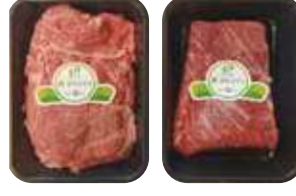
(1등급 이상/냉장) 미한우 실속세트 1호(등심700g + 국거리500g) 130,000원 2호(채끝700g + 국거리500g) 135,000원 3호(불고기700g + 국거리700g) 75,000원 4호(불고기500g + 국거리500g) 55,000원