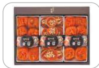
호두말이 선물세트 1호 꽃감 400g×2, 호두말이 300g 59,000원