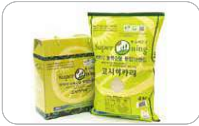
슈퍼오닝 쌀 선물세트