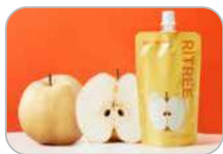
리트리 배즙 1박스 120ml 15개입 25,000원