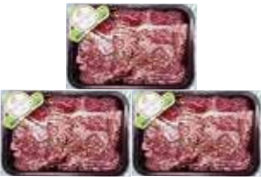
(냉장) 미한우 등심세트 등심1.8kg(600g × 3팩) 1호(1++등급) 270,000원 2호(1+등급) 225,000원 3호(1등급) 190,000원