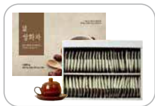
쌍화차 보현산청정약초 가루 50봉, 고명 50봉 33,500원