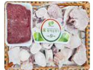
(냉동/냉장) 미한우 사골보신세트 50,000원 한우사골(3kg±150g) +국거리(500g)

게재된 상품이미지는 실제와 다소 다를 수 있으며, 일부 상품은 조기품절 되거나 미판매하는 상품이 있을 수 있습니다.