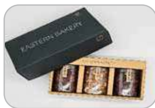
견과류정과 3구 호두정과 160g, 피칸정과 200g, 캐슈넛정과 220g 25,000원