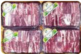
(1등급 이상/냉동) 미한우 갈비세트 215,000원 찜갈비3.2kg(800g × 4팩)