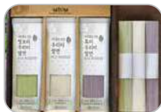
우리미 삼색 쌀면세트 우리미 쌀면 200g×3팩, 청보리 우리미 쌀면 200g×3팩, 흑미 우리미 쌀면 200g×3팩 27,000원