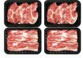
(냉장) 백정D 선물세트 93,000원 삼겹살 600g × 2팩 + 목살 600g × 2팩