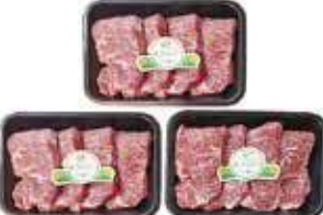
(냉장/떡갈비 냉동) 미한우 채끝세트 채끝1.8kg(600g × 3팩) 1호(1++등급) 280,000원 2호(1+등급) 235,000원 3호(1등급) 200,000원