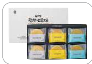
우리밀 전병선물 흑임자, 땅콩, 녹차 각 8개 27g×24개입 29,000원