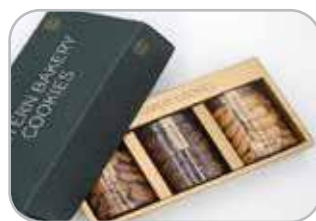
쿠키 3구 커버쳐(초코칩, 견과류) 150g, 아망떼(코코아, 아몬드) 150g, 크랜베리 150g 20,000원