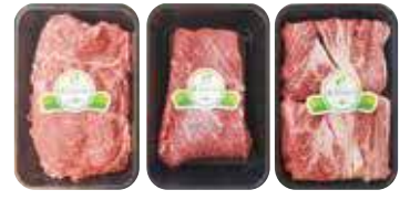
(1등급 이상/냉장) 미한우 혼합세트 180,000원 등심700g+국거리700g+ 불고기700g