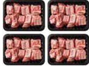
(냉장) 한돈찜갈비세트 69,000원 한돈찜갈비 800g × 4팩