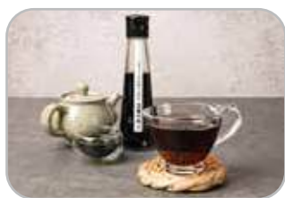
지구자차 지구자차 100ml 3개 32,000원