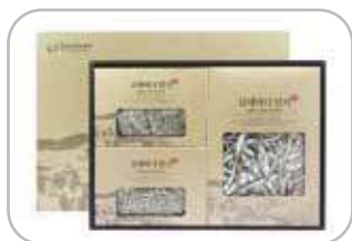
남해바다멸치 1호 국물멸치 500g, 볶음멸치 300g, 지리멸치 300g 61,000원