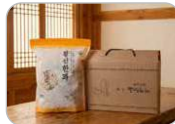
한과 선물세트 2호