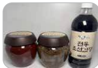
전통발효장류 세트 전통발효된장 1kg 1개, 전통고추장 1kg 1개, 전통조식간장 900ml 1개 85,000원