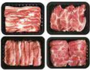
(냉장) 백정E 선물세트 140,000원 삼겹살 600g + 목살 600g + 특수부위 600g × 2팩