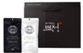
한돈장인육포세트 41,000원 육포 매운맛 50g × 4 육포 순한맛 50g × 4