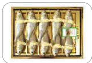
영광법성포골비 4호 1kg (10마) 114,000원